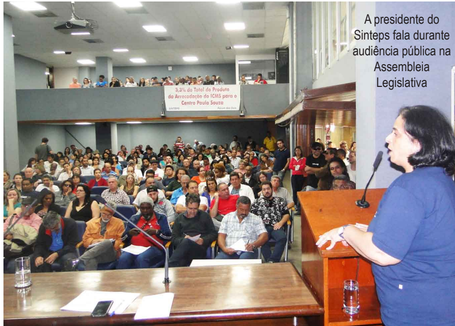
A presidente do Sinteps fala durante audiência pública na Assembleia Legislativa

O dia 23 de junho foi de luta por mais recursos para a educação pública paulista. Caravanas das três universidades estaduais paulistas e do Centro Paula Souza (Ceeteps) lotaram o auditório Franco Montoro, na Assembleia Legislativa (Alesp). Trabalhadores e estudantes acompanharam a audiência pública convocada pelas comissões de Finanças, Orçamento e Planejamento (CFOP) e de Ciência, Tecnologia e Informação (CCTI), a pedido do Fórum das Seis, que congrega os sindicatos das universidades e o Sinteps.