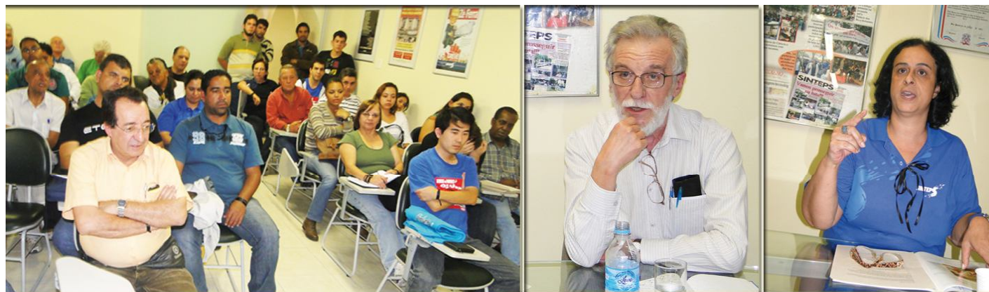
Os palestrantes durante o seminário, na sede do Sinteps: Centro mantém estrutura de poder arcaica