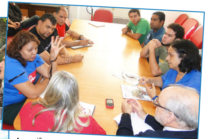
A reunião com a Superintendente foi realizada logo após o ato

diretores e representantes de base da entidade no início da tarde. O objetivo foi cobrar a continuidade das negociações em torno à data-base 2012.