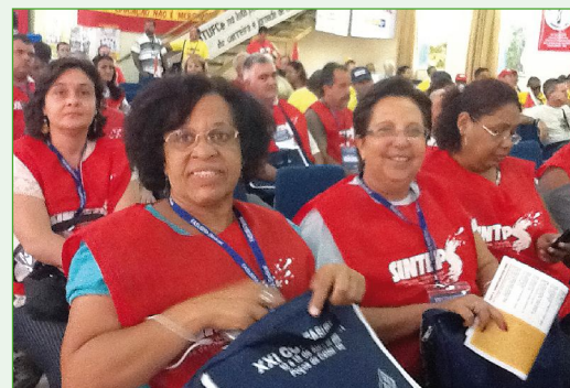
Parte dos delegados do Sinteps durante o XXI Confasubra

A avaliação dos delegados do Sinteps é que, embora desorganizado, o XXI Confasubra marcou uma etapa importante na nossa luta por fortalecer as bandeiras da educação profissional e tecnológica no país.